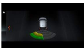
Система допомоги при парковці (PDC), задня S0507