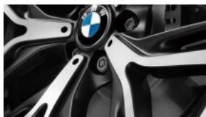
Болти-секретки для коліс S02PA