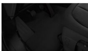
Велюрові килимки S0423