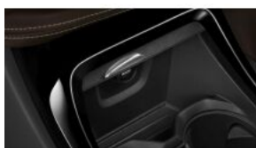
Підготовка автомобіля для курців S0441