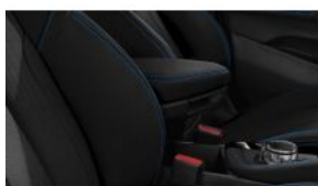
Передній центральний підлокітник S0473