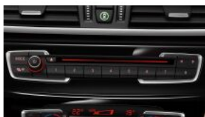
CD плеєр S0650