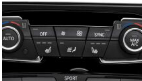
Підігрів передніх сидінь S0494