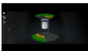
Система допомоги при парковці (PDC), передня і задня S0508