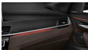
Розширений пакет освітлення салону S0563