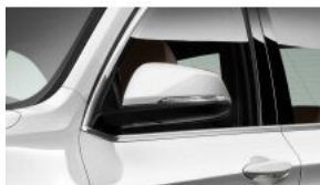
Пакет устаткування бічних дзеркал S0313