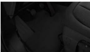
Велюрові килимки S0423