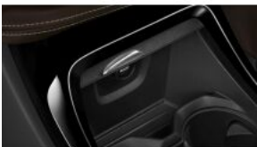
Підготовка автомобіля для курців S0441