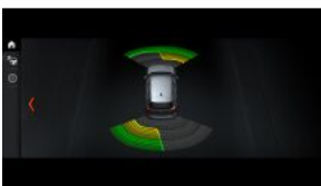
Система допомоги при парковці (PDC), передня і задня S0508