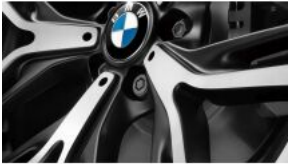
Болти-секретки для коліс S02PA